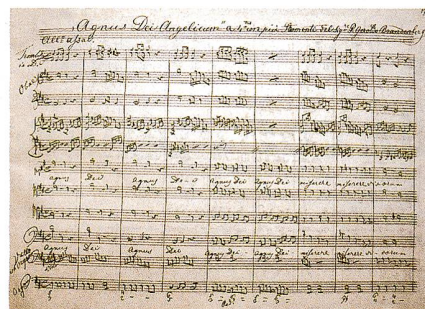
Bibliothèque musicale du couvent d'Einsiedeln