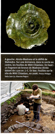
A gauche: Airolo-Madrano et le défilé de Stalvedro. Sur une éminence, dans le cercle au centre, les fouilles de Mött Chiaslasc. En haut: un fragment de bronze de Madrano Airolo datant de 1500 av. J.-C. En bas: fouilles sur le site de Mött Chiaslasc, en 2006.