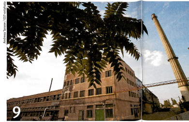
En Roumanie, d'anciennes industries hypothèquent la santé de la population.