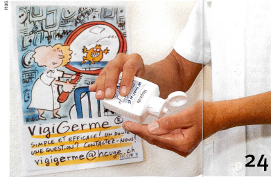
A l'hôpital, une bonne hygiène des mains sauve des vies.