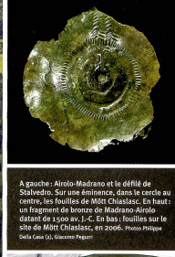
A gauche: Airolo-Madrano et le défilé de Stalvedro. Sur une éminence, dans le cercle au centre, les fouilles de Mött Chiaslasc. En haut: un fragment de bronze de Madrano Airolo datant de 1500 av. J.-C. En bas: fouilles sur le site de Mött Chiaslasc, en 2006.

L'arc alpin était donc à cette époque un « espace économique en plein boom », affirme Thomas Reitmaier, collaborateur scientifique du projet. L'exploitation du minerai, l'essor de la production de métal