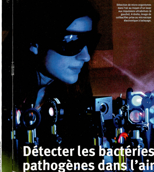
Détection de micro-organismes dans l'air au moyen d'un laser aux impulsions ultrabrèves (à gauche). A droite, image de colibactéries prises au microscope électronique à balayage.

S'il est relativement aisé de distinguer la première catégorie des deux autres, il est beaucoup plus difficile de faire la différence entre les grains de suie et les bactéries qui ont des compositions chimiques très semblables. Tous sont constitués de « composés aromatiques polycycliques » - des molécules formées de cycles d'atomes de carbone. Toutefois, dans les micro-organismes, ces cycles sont munis de « bras » d'acides aminés,