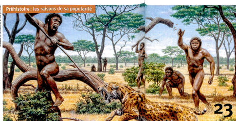
Préhistoire : les raisons de sa popularité