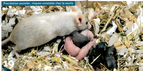
Procréation assistée : risques constatés chez la souris