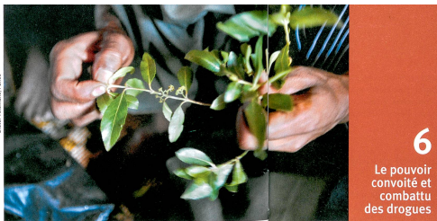
6 Le pouvoir convoité et combattu des drogues