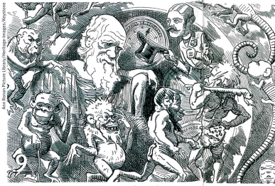
Darwin penseur controversé, ici dans une caricature de 1882.