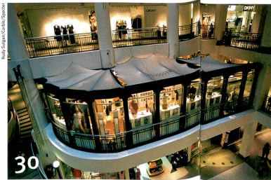
Comment mieux exploiter le sous-sol des villes, à l'exemple de Montréal.