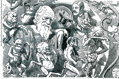
Darwin penseur controversé, ici dans une caricature de 1882.