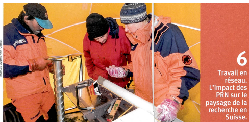
6 Travail en réseau. L'impact des PRN sur le paysage de la recherche en Suisse.