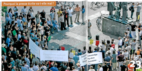
23 Pourquoi la presse écrite va-t-elle mal ?