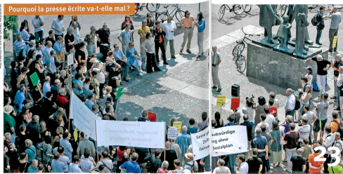
23 Pourquoi la presse écrite va-t-elle mal ?