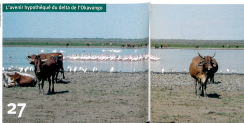
27 L'avenir hypothéqué du delta de l'Okavango