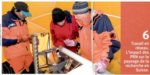
6 Travail en réseau. L'impact des PRN sur le paysage de la recherche en Suisse.