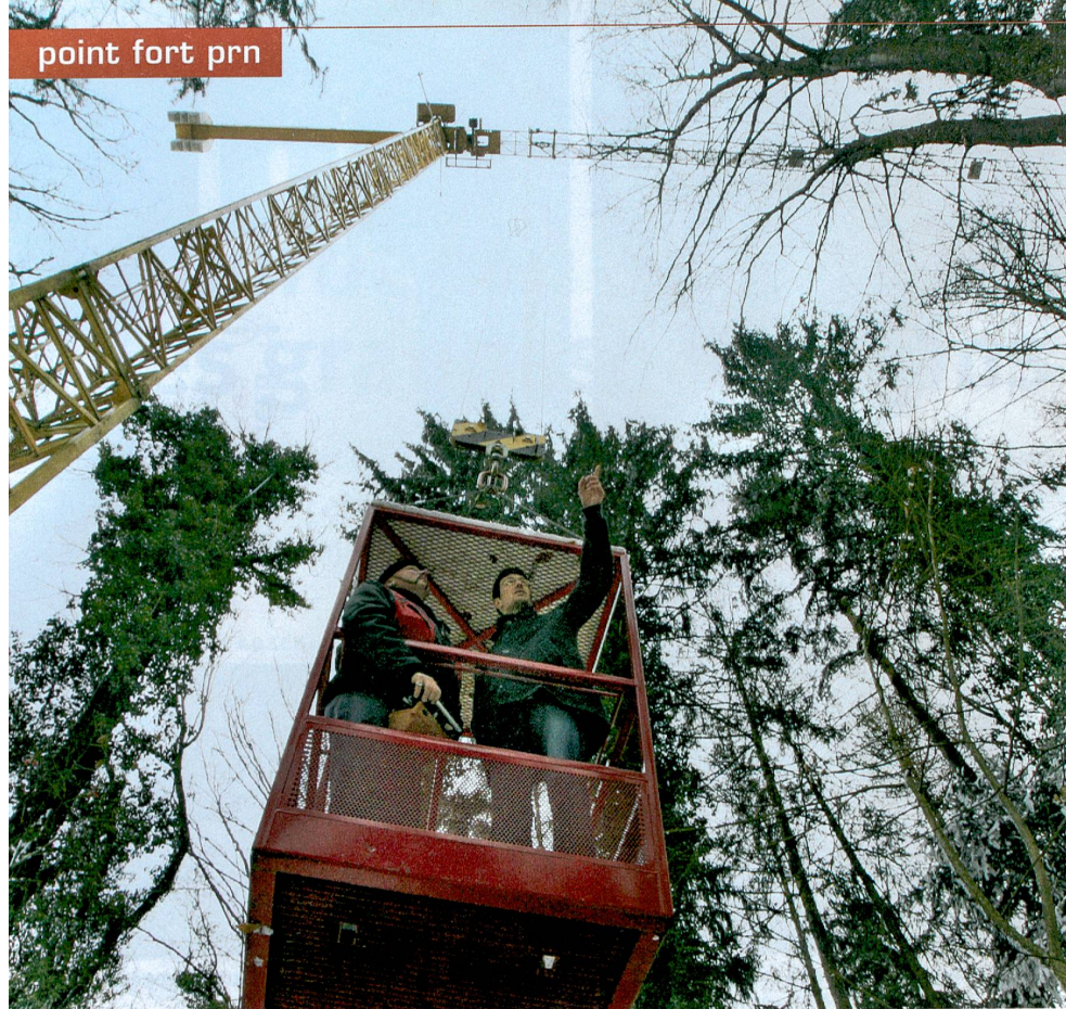
Le PRN Climat étudie entre autres l'impact du \text{CO}_2 sur la croissance des arbres.

ments. Mais dès 2013, une fois le soutien du FNS terminé, «l'argent nécessaire à ces travaux de coordination ne sera plus disponible», relève Martin Grosjean. Chaque haute école n'encouragera alors plus que les projets de ses propres chercheurs.