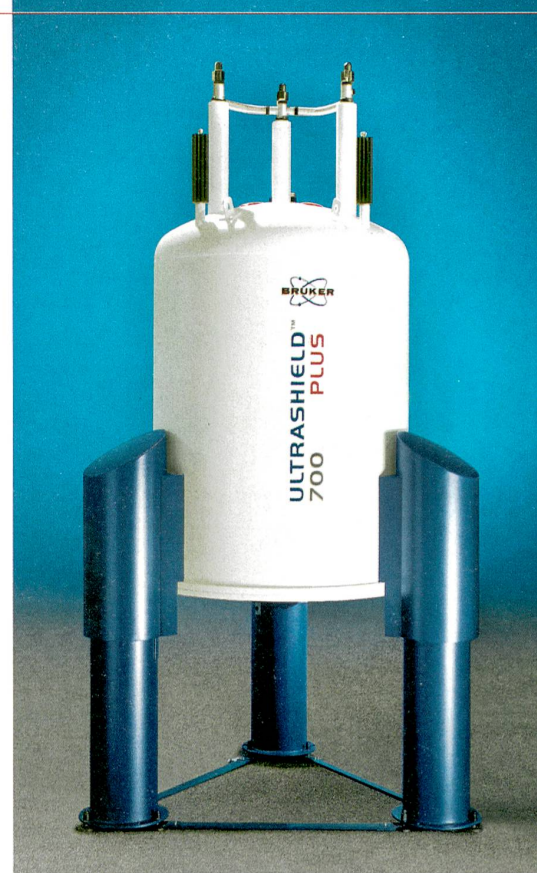
De l'expérimentation à l'application. Les recherches sur les matériaux supraconducteurs du PRN MaNEP ont permis d'augmenter la puissance des spectromètres à résonance magnétique nucléaire. Ceux-ci facilitent par exemple le développement de nouveaux médicaments.

mente dans l'atmosphère. Ces données sont intégrées aux modèles des spécialistes en écologie forestière, dirigés par Harald Bugmann à l'EPFZ, qui évaluent les réactions au réchauffement des forêts de toute la Suisse. Les modèles climatiques régionaux de l'équipe de Christoph Schär, à l'EPFZ également, sont ensuite en mesure de montrer quel est l'impact sur le climat de la région, et donc sur les arbres de la forêt de Bâle-Campagne, de ces changements intervenus en surface. Ceci pour déterminer par exemple si ces mêmes forêts reçoivent plus ou moins de précipitations. « Nous devons assembler les différentes parties du tout, comme dans la nature », explique Martin Grosjean.