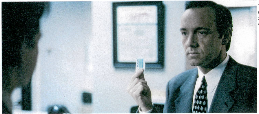
Amateur d'édulcorants. Kevin Spacey dans le film américain « Swimming with Sharks » (1994).

Science, 2009, vol. 324, pp. 636-638. Accès en ligne : www.zora.uzh.ch/18666