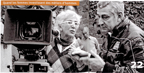
Quand les femmes investissent des métiers d'hommes.