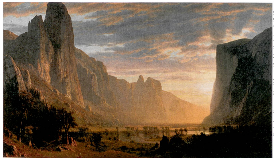
La vallée de Yosemite, un site exceptionnel à la beauté préservée (Albert Bierstadt: « Looking Down Yosemite Valley », 1865).