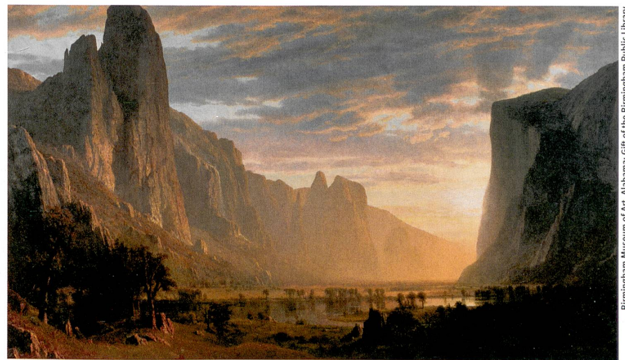
La vallée de Yosemite, un site exceptionnel à la beauté préservée (Albert Bierstadt: « Looking Down Yosemite Valley », 1865).