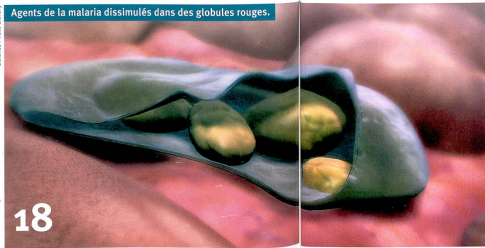
Agents de la malaria dissimulés dans des globules rouges.

6 A Madagascar, la sauvegarde de la biodiversité porte préjudice aux indigènes.