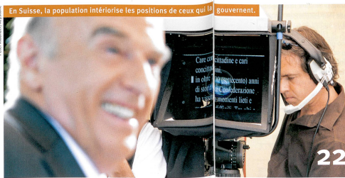
En Suisse, la population interiorise les positions de ceux qui la gouvernent.