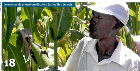
Le manque de phosphore décolore les feuilles de maïs.