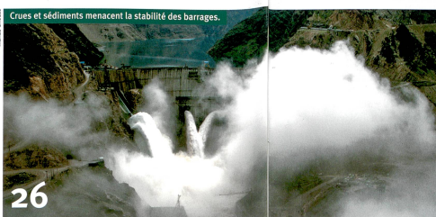
Crues et sédiments menacent la stabilité des barrages.