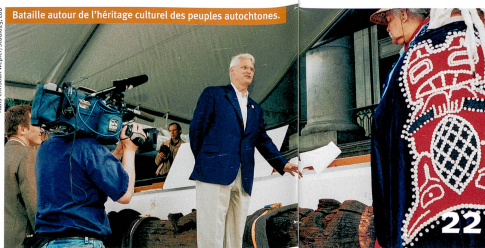
Bataille autour de l'héritage culturel des peuples autochtones.