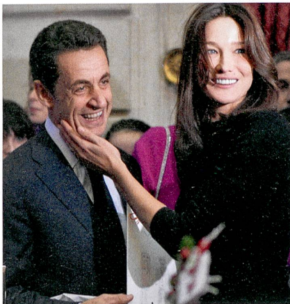
Une relation marquée par le narcissisme ? Nicolas Sarkozy et Carla Bruni-Sarkozy (2009).