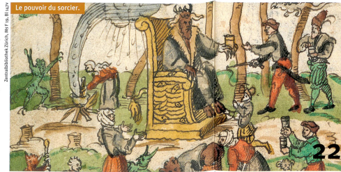
Le pouvoir du sorcier.