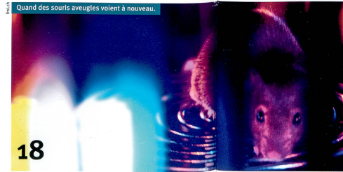
Quand des souris aveugles voient à nouveau.