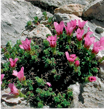
A travers la roche : la saxifrage pousse jusqu'à 4505 mètres d'altitude.