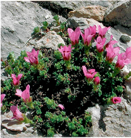
A travers la roche : la saxifrage pousse jusqu'à 4505 mètres d'altitude.