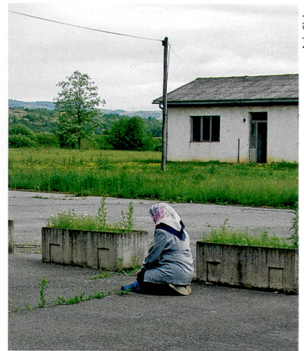
Interrogatoires, viols : le temps du souvenir à Omarska (mai 2005).

fants autistes et l'ont comparée avec celle d'enfants atteints de déficit intellectuel. Résultat : la compréhension des premiers dépasse celle des seconds après une année. Les autistes apprennent l'empathie et peuvent partager l'expérience émotionnelle des autres. « Mais il faut le leur enseigner, car ce n'est pas dans leur intuition », souligne Evelyne Thommen. Ce travail se fait sur deux volets. Le premier, théorique, consiste à leur expliquer ce que sont les émotions, à les définir, à leur montrer comment elles s'expriment. Le second à tirer parti de situations réelles (dispute, chagrin) pour intégrer la théorie. Au final, ils auraient même accès à l'amitié. Fabienne Bogadi