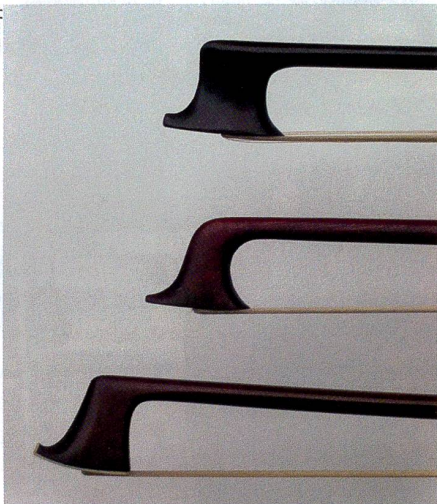
Trois types d'archets de la première moitié du XIXe siècle produisant des sons différents.