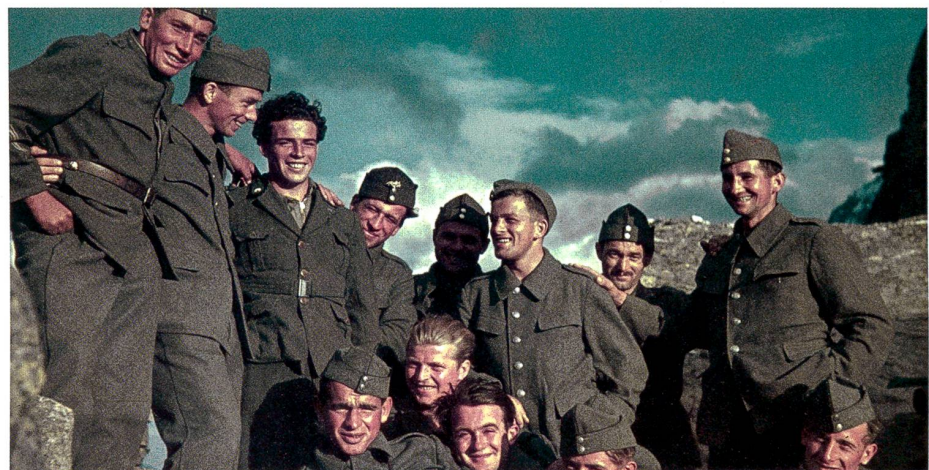
Des soldats suisses à la frontière italienne, en 1940.

volonté de ressembler à Schwarzenegger, note Fabien Ohl. C'est l'emprise progressive de la pratique, faite d'ascèse et de discipline, qui les mènera plus loin. » Jusqu'à la « conversion » parfois, qui modifiera normes morales et esthétiques et cautionnera la consommation de produits illicites, partagée comme un secret et légitimée par des « experts-coachs ». La recherche s'oriente aussi vers la dynamique de la musculation. Car après la revanche physique – nombre de bodybuilders ont vécu leur corps comme peu conforme aux normes – la maîtrise de soi, la valorisation professionnelle, pour les métiers de la sécurité, viendra le vieillissement. Et après la conversion, la reconversion. Dominique Hartmann ■