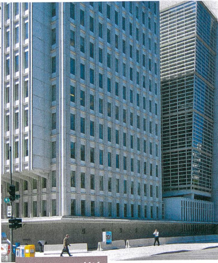
Culture et société