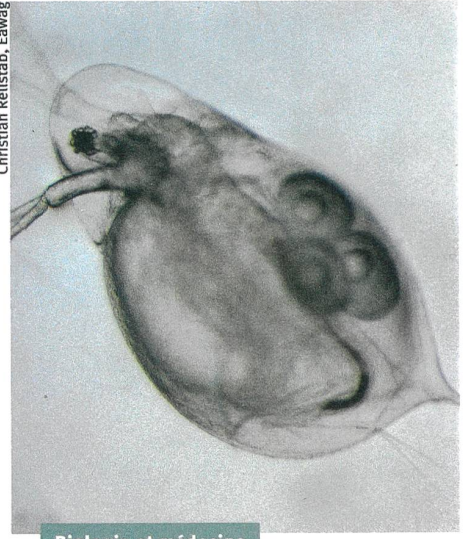
Biologie et médecine