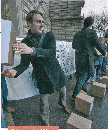
Science et politique