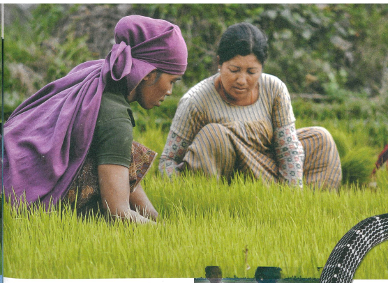
Le risque de se faire mordre par un cobra en travaillant dans une rizière est élevé. Les morsures de bungare ( Bungarus caeruleus , ci-dessous) font aussi de nombreux morts chaque année. Au centre et en bas: transport d'une victime vers un centre de traitement; formation à l'intubation et examen d'une morsure. Photos: François Chappuis, Sanjib Sharma, David Warrell

Les résultats n'ont pas montré de différences entre les deux traitements. Nous préconisons toutefois le dosage fort. Il est plus pratique, surtout quand les praticiens ne sont pas médecins et travaillent en zone rurale. Dans le cas d'une morsure de cobra, la résolution des symptômes de neurotoxicité est beaucoup plus rapide. Mais ce n'est pas le cas avec les morsures de bungare. Au point que nous nous demandons, comme d'autres, si les antivenins ont la moindre efficacité contre les morsures de ce serpent. Heureusement, le dosage fort n'est pas plus toxique en cas de morsure de bungare, mais son manque d'efficacité souligne l'importance d'avoir du personnel formé à la réanimation et à la ventilation.