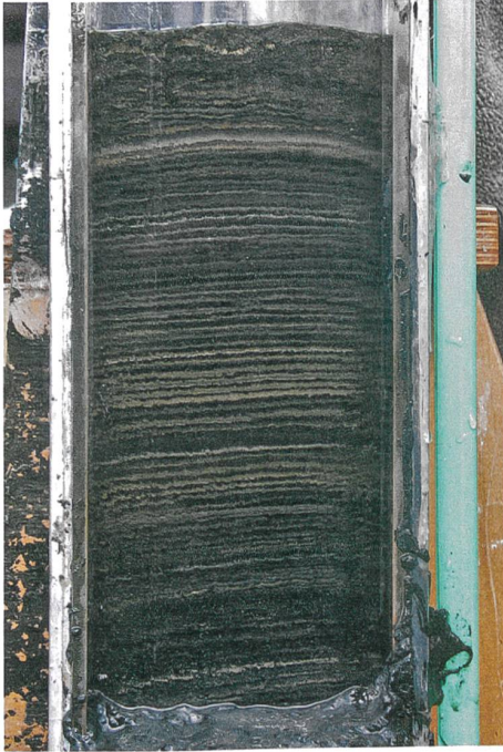
Carotte de sédiments du fond du lac de Greifen. Les différentes couches permettent de lire le passé.

Les puces d'eau, ou daphnies, mesurent un à deux millimètres. Elles comptent parmi les plus petites espèces de nos lacs, mais leur importance est majeure. Présentes par milliards dans les plans d'eau, elles constituent la principale source de nourriture des poissons juvéniles. Des chercheurs ont fait à présent une découverte inquiétante: leur diversité génétique s'est fondamentalement modifiée au cours des cent dernières années. La faute à l'être humain.