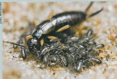
La femelle perce-oreille maternelle s'occupe de ses petits.

J.W.Y. Wong, C. Lucas & M. Kölliker (2014): Cues of Maternal Condition Influence Offspring Selfishness. PLoS ONE 9: e87214.