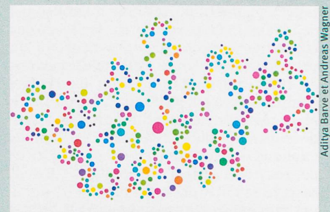
Représentation symbolique des processus métaboliques chez des bactéries virtuelles.

A. Barve & A. Wagner (2013): A latent capacity for evolutionary innovation through exaptation in metabolic systems . Nature 500: 203-206.