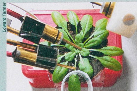
Les électrodes mesurent les signaux électriques de l'arabette des dames.

S. A. R. Mousavi, A. Chauvin, F. Pascaud et al. (2013): GLUTAMATE RECEPTOR-LIKE genes mediate leaf-to-leaf wound signaling . Nature 500: 422-426.