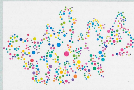
Représentation symbolique des processus métaboliques chez des bactéries virtuelles.

A. Barve & A. Wagner (2013): A latent capacity for evolutionary innovation through exaptation in metabolic systems . Nature 500: 203-206.