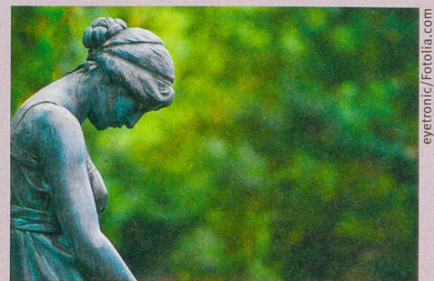
Un grand manque d'estime de soi peut rendre malheureux.

U. Orth, R.W. Robins (2013): Understanding the link between low self-esteem and depression . Current Directions in Psychological Science , 22, 455-460.