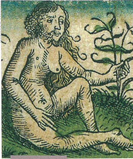
Culture et société