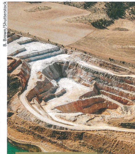
Environnement et technique