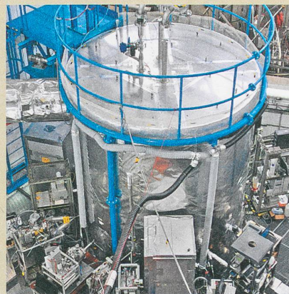
Le rôle de l'alpha-pinène a été confirmé par des expériences dans la chambre à nuage du CERN.