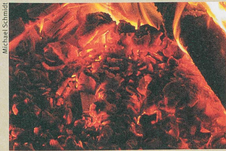
Même les résidus de bois brûlé les plus fins sont riches d'enseignement.