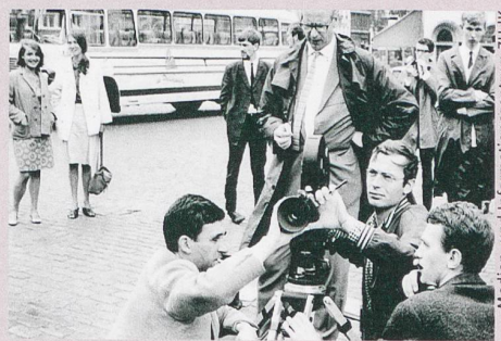
Des étudiants suisses en cinéma apprenant les ficelles du métier à la fin des années soixante.

Thomas Schärer: Zwischen Gotthelf und Godard. Erinnernte Schweizer Filmgeschichte 1958-1979 . Limmat Verlag, Zurich 2014, 701 p.