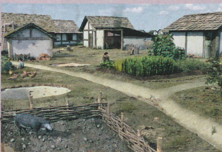
Reconstruction de la cité celte bâloise datant de 100 av. J.-C. environ.

Archäologische Bodenforschung Basel-Stadt