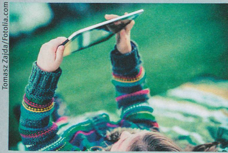
Tous les enfants cancéreux devraient être intégrés dans des études cliniques.