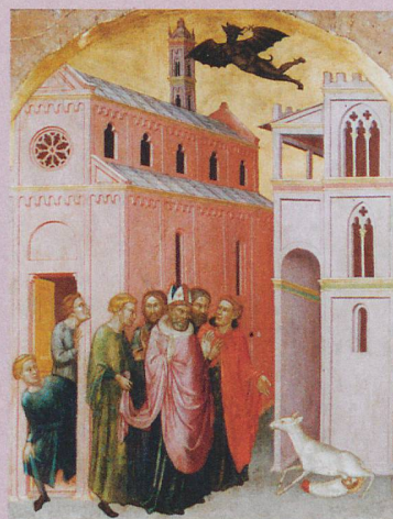
Une biche allaite saint Stéphane dans cette peinture de Martino Di Bartolomeo (vers 1435).

Y. Foehr-Janssens et al.: Représentations de l'allaitement au Moyen Âge: invisibilité ou prolifération matérielle et légendaire. Soumis à: Allaitement et pratiques de sevrage: approches pluridisciplinaires et diachroniques (Paris, Ed. de l'INED), 2015