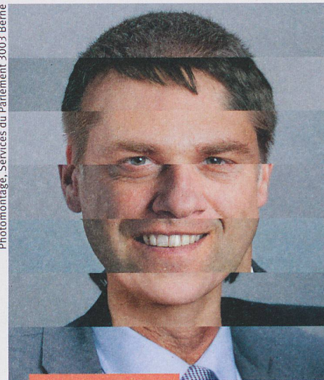
Photomontage, Services du Parlement 3003 Berne

◀ Couverture: la recherche esquisse une image du monde toujours plus détaillée et complexe. L'erreur fait partie du processus et génère de nouveaux points de vue. Photo: Yoko Ono «Map Piece» 1964, © Yoko Ono