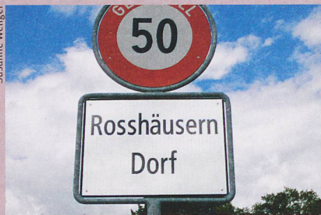
Derrière ce nom se cache un certain «Rudolf».

Ortsnamenbuch des Kantons Bern, volume 5 à paraître en automne 2015. A. Francke Verlag, Bâle et Tübingen