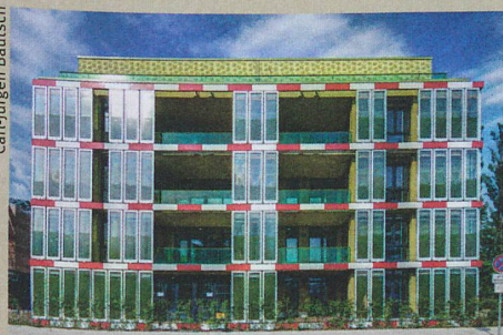
La maison allemande BIQ produit de la biomasse à partir d'algues et inspire les chercheurs.