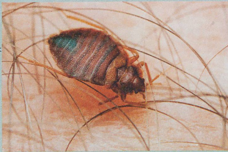
Des compagnons de lit peu appréciés qui développent des résistances.