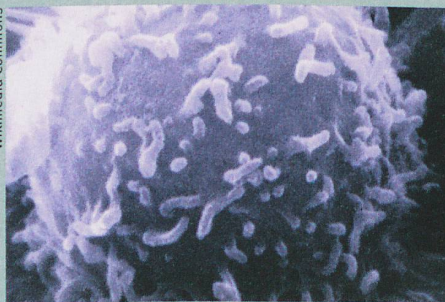
Des lymphocytes manipulés pourraient empêcher le rejet d'un organe étranger.