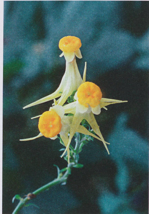
... et sa forme «monstrueuse» ( peloria ). La raison de leur différence: une seule mutation épigénétique.