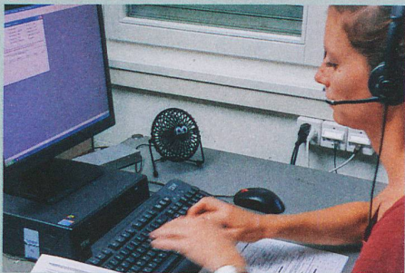
Les interviews téléphoniques d'une équipe bernoise révèlent des troubles délirants non traités.

C. Michel et al.: Demographic and clinical characteristics of diagnosed and non-diagnosed psychotic disorders in the community. Early Intervention in Psychiatry (2016)