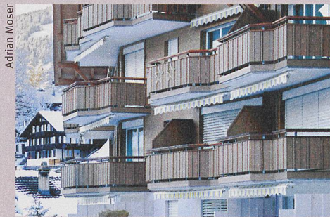
Evolution inattendue: le prix des résidences principales a diminué dans les régions touristiques.

Le programme atteint les adolescents par SMS au moment où ils boivent: en sortie.