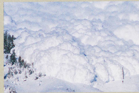
Un radar observe l'intérieur d'une avalanche artificielle déclenchée près d'Arbaz (VS).