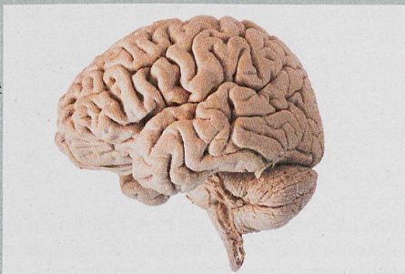
Les cerveaux ne sont pas tous pareils, mais certains se ressemblent davantage.

G. E. Doucet et al.: Person-Based Brain Morphometric Similarity is Heritable and Correlates With Biological Features. Cerebral Cortex (2018)