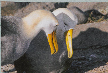
Un couple d'Albatros des Galapagos, un exemple de fidélité dans le monde animal.