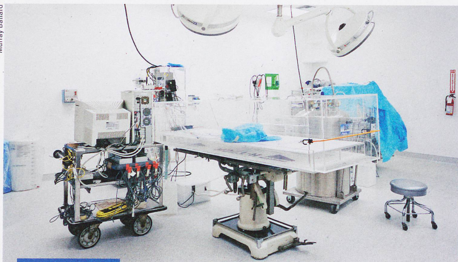
Science et croyance