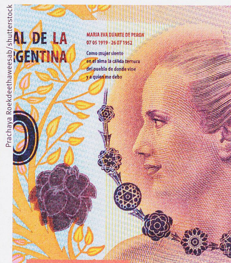
Science et politique