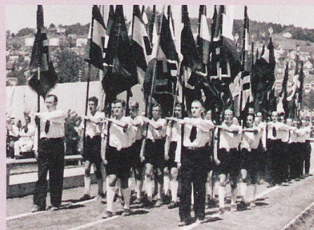
La «Colonie allemande en Suisse» marche à travers le Letzigrund en 1941.