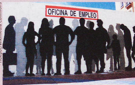
Un graffiti dans la ville espagnole de Saragosse illustre le chômage dans le pays.

M. Vacchiano et al.: The family as (one- or two-step) social capital: mechanisms of support during labor market transitions. Community, Work and Family (2019)