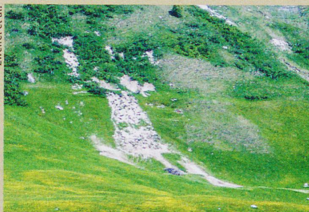
Une pente érodée dans la vallée d'Urseren, notamment à cause de l'élevage bovin.